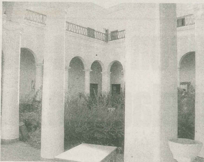
■ Seminario Conciliar. Vista de un patio interior.

Antiguamente era un lago artificial, servía para reservar agua proveniente del río El Tala. Fue un centro de esparcimiento y se podía dar un tranquilo paseo en bote. Caravati se encargó de la dirección y remodelación de un diseño anterior. El paseo conocido en la ciudad